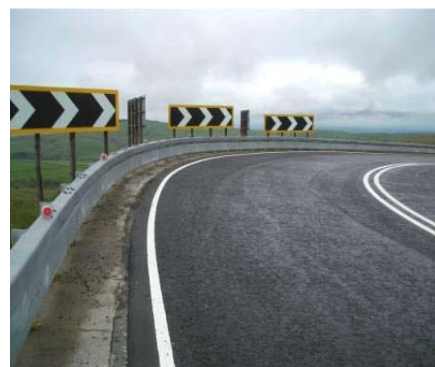
Ar ôl gosod Bikeguard

I gael gwybod rhagor, ewch i wefan Highway Care website