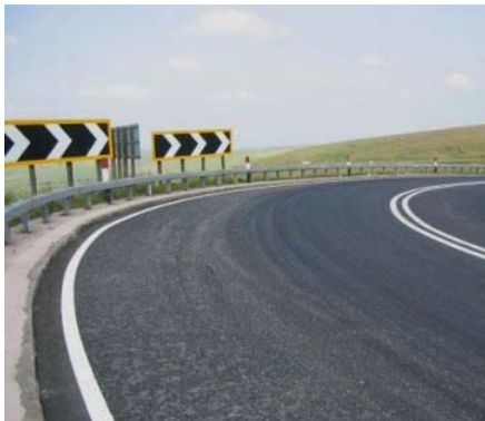
Cyn gosod Bikeguard